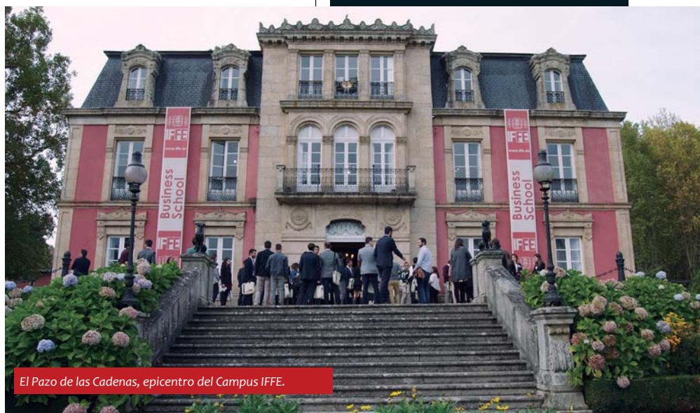
El Pazo de las Cadenas, epicentro del Campus IFFE.

IFFE Business School tiene su sede en la denominada Finca Alsina o Pazo de las Cadenas, en el municipio de Oleiros y al pie de la N-VI, un espacio de casi diez hectáreas en el que se sitúa la mansión construida en 1875 bajo la dirección del